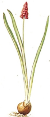
Hyacinthus Botryoides caeruleus.