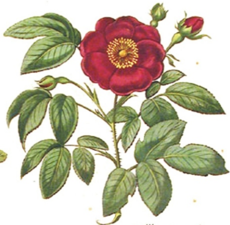
Rosa Mulsina rubra flore frapl:

6. Мама - Одуванчик, (см. стр. №5) потому что она очень мягкая. Бабушка - Кактус (см. стр. №12). Она нам с братом может и наподдать. Правда это случается, когда мы её немного злим. А вообще-то и мама и бабушка умные и красивые, как две Розы.