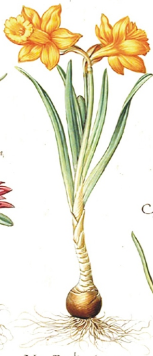
Narcissus totus luteus montanus maior.