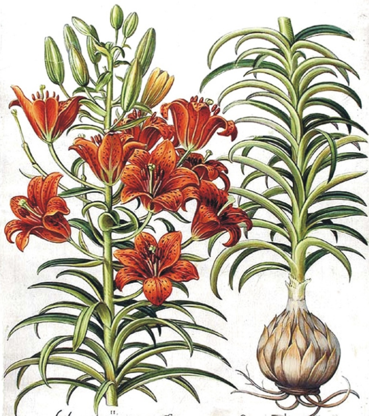
Lilium purpuraceum matius Do. donci.