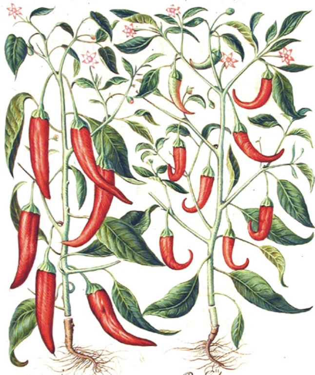
Piper Indicum maximum longum.