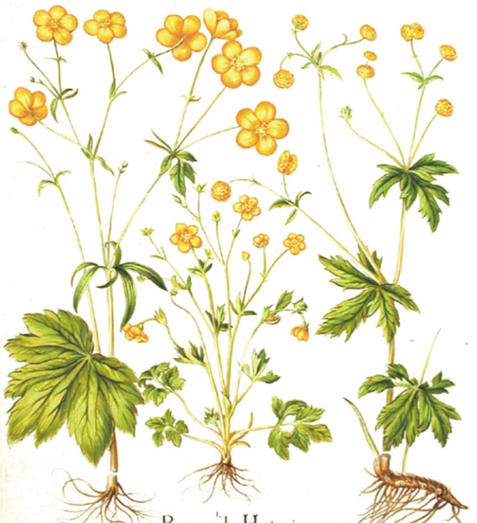
Ranunculus Montanus ma ix flz luteo .

9. Моя мама очень похожа на Лютик. Она такая добросердечная и жизнерадостная.