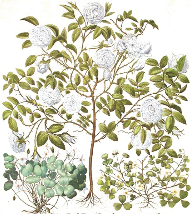
Trifolium pictum flore albo. Rosa Damascena flore pleno. Trifolium pictum flore flavo.

11. Мама - и Роза, и Тюльпан (см. стр. №6, 7, 13), очень-очень красивая и добрая. Бабушка Лера - Лилия, (см. стр. №4, 15) очень-очень нежная.