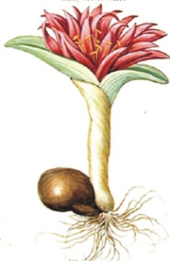
Colchicum Verum, flore purpureo flentibus.