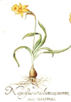
Narcissus totus luteus montanus, minor.