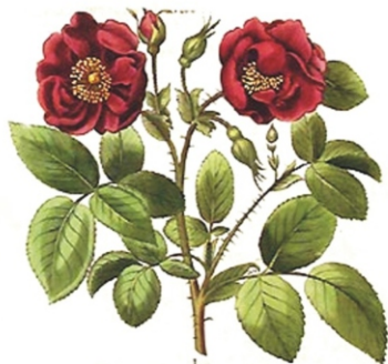
Rosa ex rubro nigricans flore pleno.

8. Мама - Роза, очень- очень красивая, добрая! Милая!!! Бабушка - солнечный Одуванчик (см. стр.№5), добросердечная.