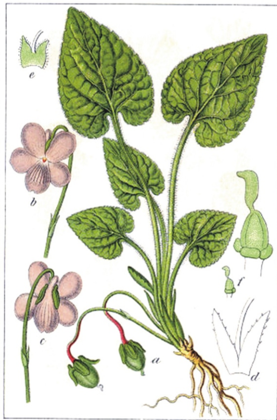
Rauhhaariges Veilchen, Viola hirta .