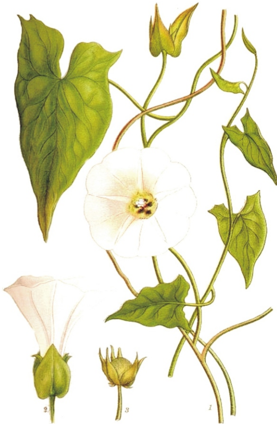
SNÄRVINDA, CONVOLVULUS SEPIUM L.