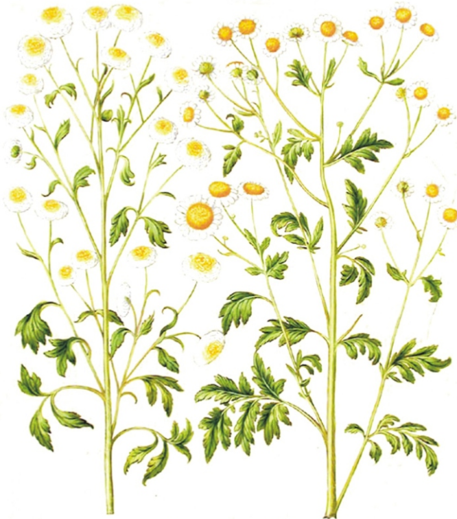
Matricaria flore pleno.