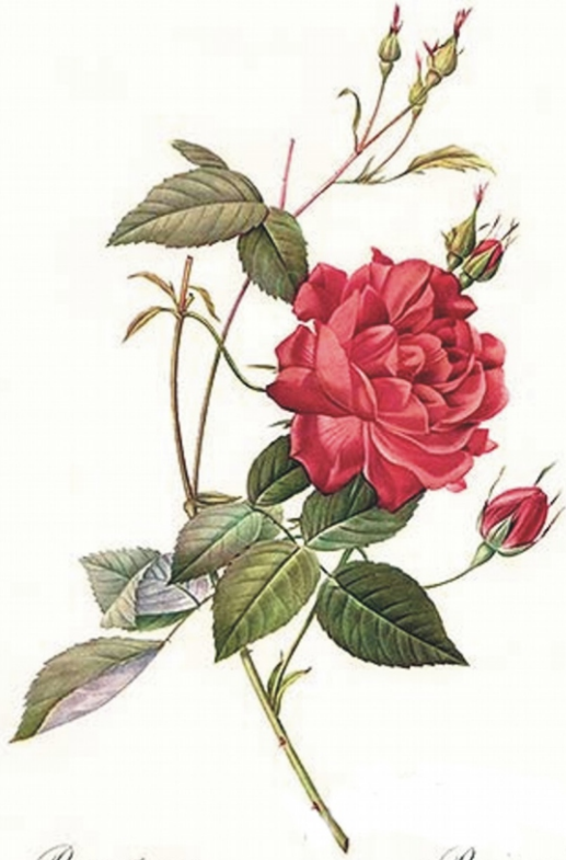
Rosa Indica Coventia.