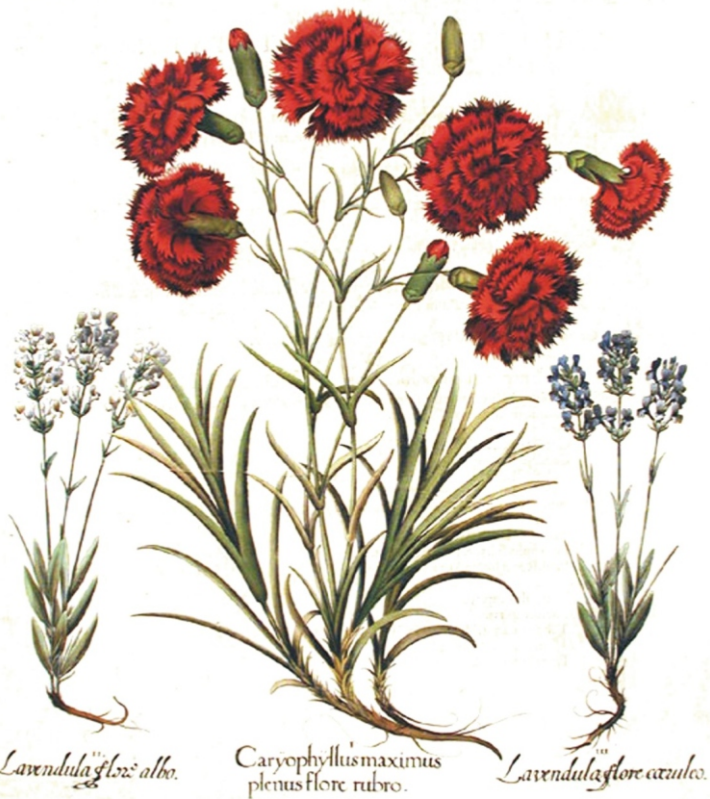
Lavendula flore albo.